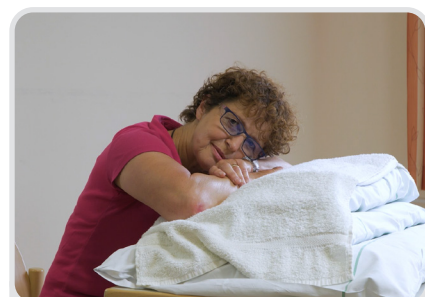
Video unter mehr-luft.at/copd-kurs

Wenn Sie einen Tisch und ein Kissen zur Verfügung haben, können Sie die Schultern bequem aufstützen indem Sie Ihre Arme auf dem Kissen auflegen und Ihren Kopf darauf legen.